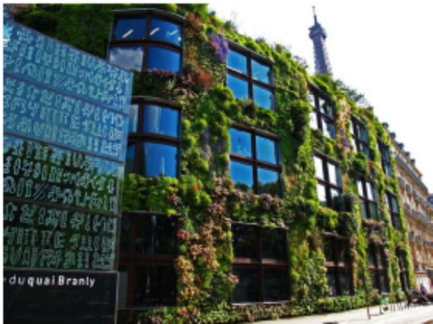
Doc2 - Musée du Quai Branly, Paris