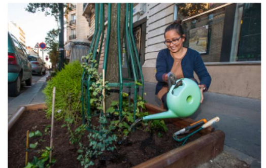
Doc4 - Femme jardinant dans Paris

Observe le doc3. Où la photo a-t-elle été prise ?