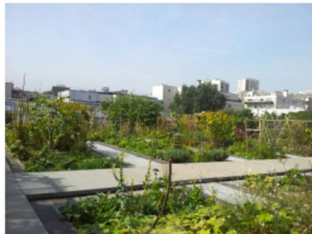
Doc3 - Jardin sur les toits, Paris