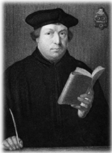
Martin Luther (1483-1546)

Au début du XVI ème siècle, Martin Luther propose une réforme de la religion catholique mais le pape la rejette. Il fonde alors une nouvelle religion : le protestantisme. Elle se répand dans toute l'Europe. Les conflits entre catholiques et protestants se multiplient. C'est le début des guerres de religion en France qui durent de 1562 à 1598. Le massacre de la Saint Barthélemy en 1572 est un épisode sanglant.