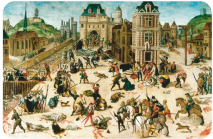
Le massacre de la Saint-Barthélemy (1572)