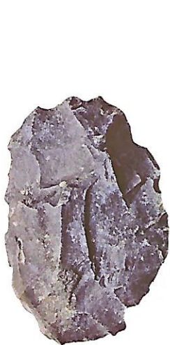
Un racloir (silex, vers 50 000 avant J.-C.).