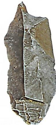
Un perceur (silex, entre 15 000 et 10 000 avant J.-C.).