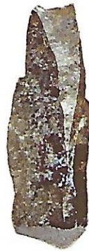
Un burin (silex, vers 25 000 avant J.-C.).