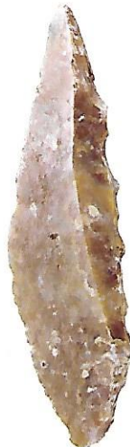
Une pointe (silex, vers 34 000 avant J.-C.).