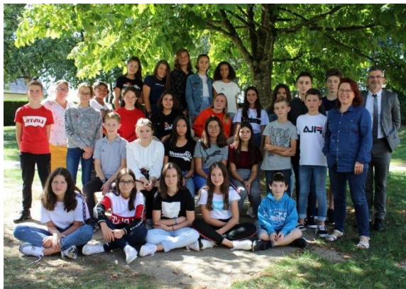
Les deux classes de cadets de l'Oriette : promotions 2020 et 2021

Une nouvelle année scolaire, une nouvelle promotion de « Cadets de la sécurité civile » élargie au niveau 4 e .