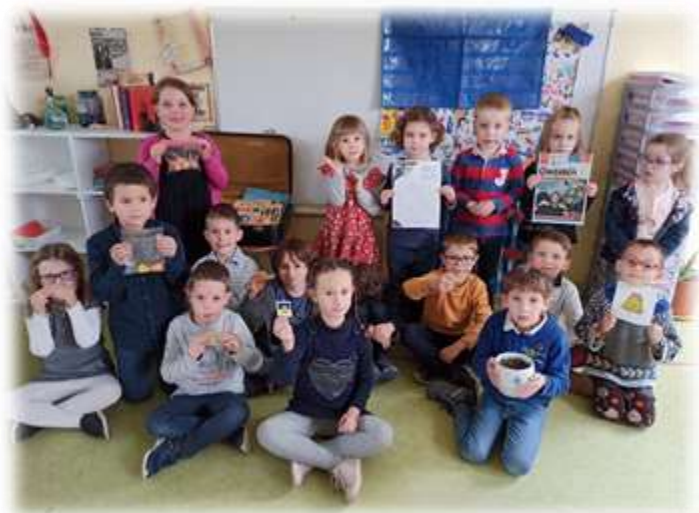
Les élèves de GS/CP participent à des expériences.