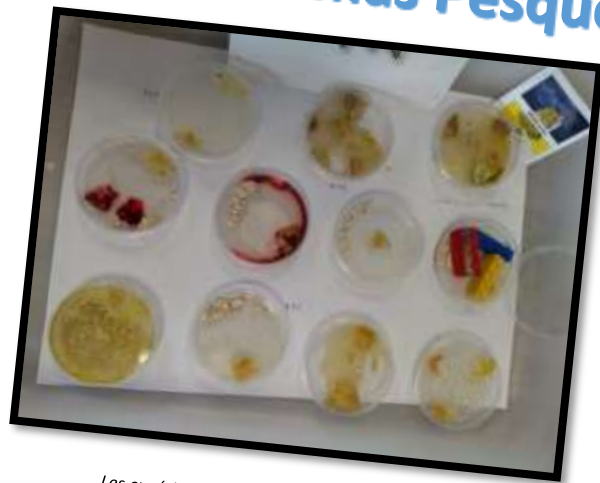
Les expériences sur le blob.