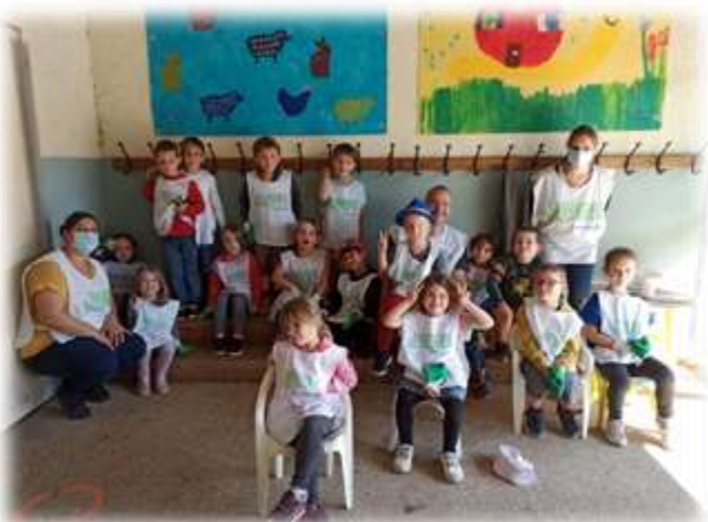
Les élèves de GS/CP nettoient la nature.