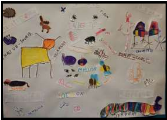
Affiche sur la faune de la forêt de Bercé