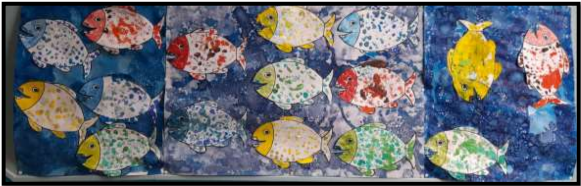
Fresque de la mer des PS MS.