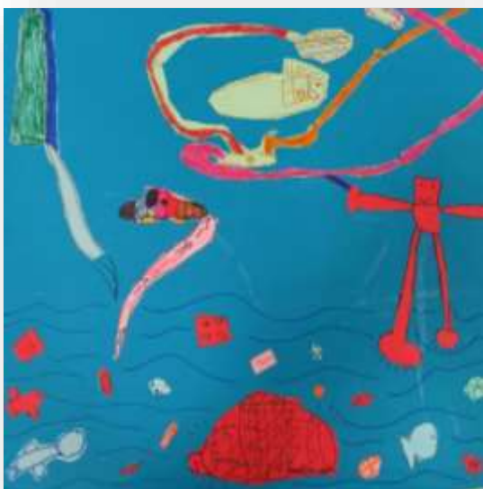
Divers moyens de nettoyage de la mer.