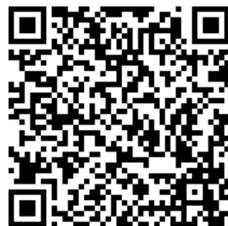
Logo de la radio.

Magik Radio La radio des petits sorciers