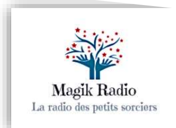
Logo de la webradio