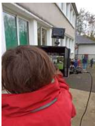
Les élèves réalisent leur webTV.