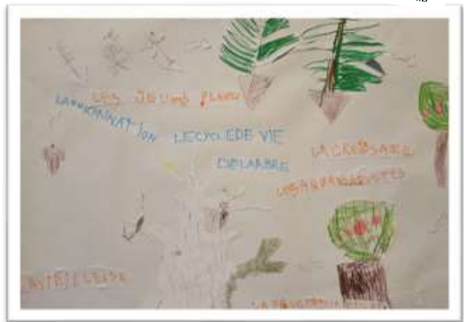
Affiche sur le cycle de vie de l'arbre.