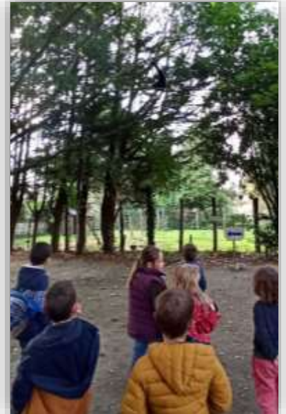
Les élèves observent les primates au zoo de Spay.