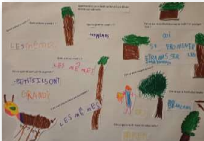
Affiche sur comment était la forêt il y a 60 ans