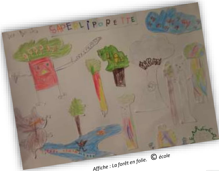
Affiche : La forêt en folie. © école

Expositions sur la protection de la forêt :