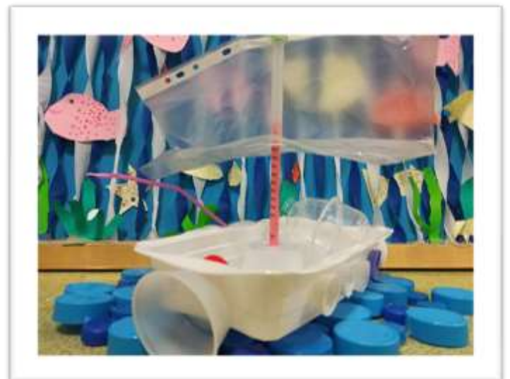
Maquette d'un bateau collecteur de déchets. © école