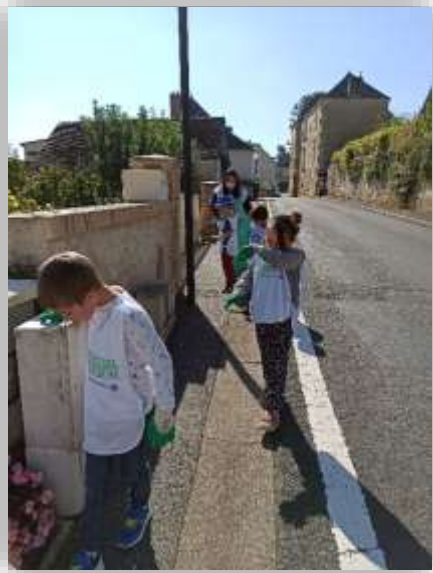
Les élèves de GS/CP nettoient la nature