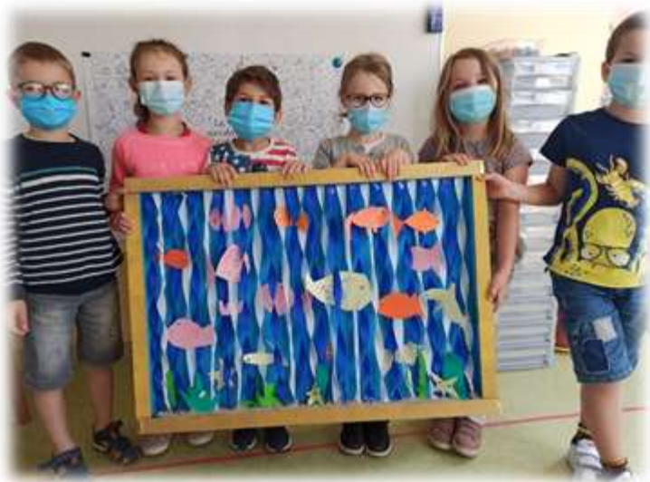
Représentation de la mer par les GS/CP.