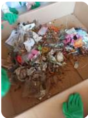
Les élèves nettoient la nature.