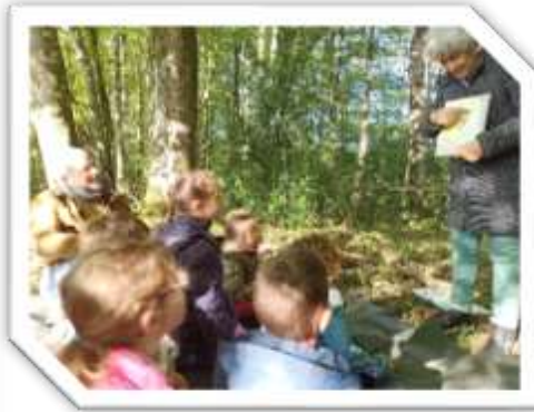
Les élèves de Courdemanche en randonnée conté.