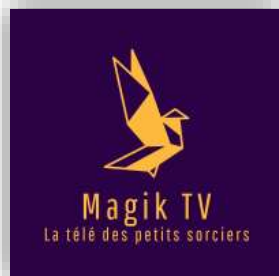
Logo de la webTV