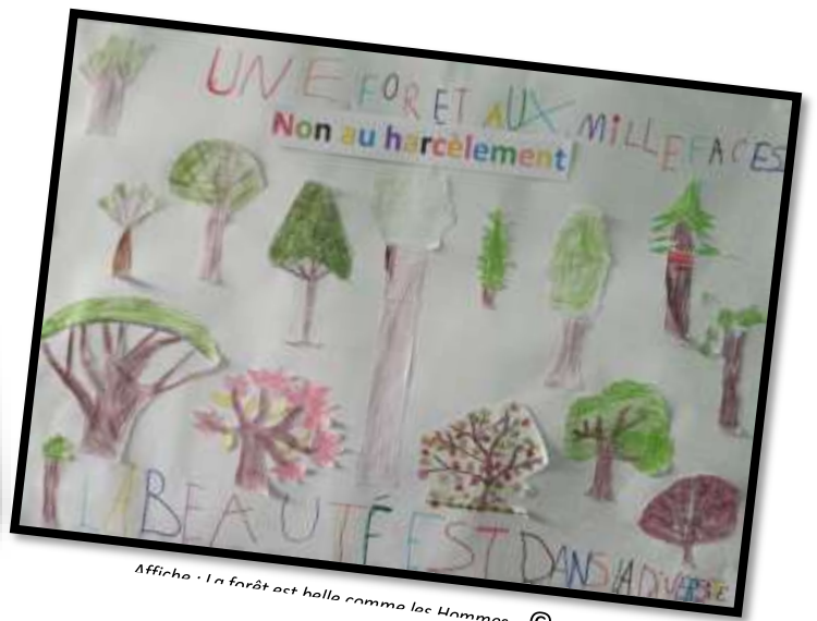
Affiche : La forêt est belle comme les Hammes. © école