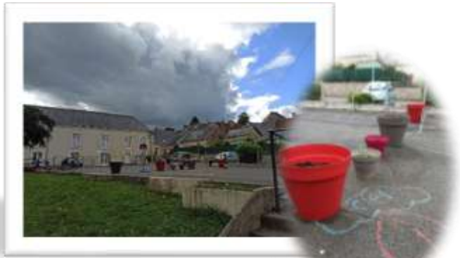
Aménagement de la cour.