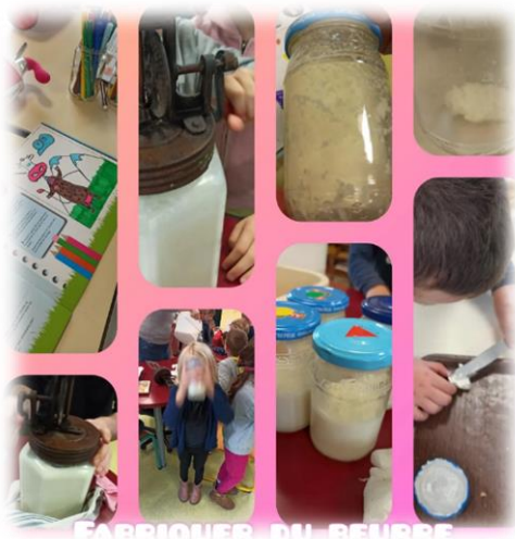
FABRIQUER DU BEURRE Fabrication de beurre p.4