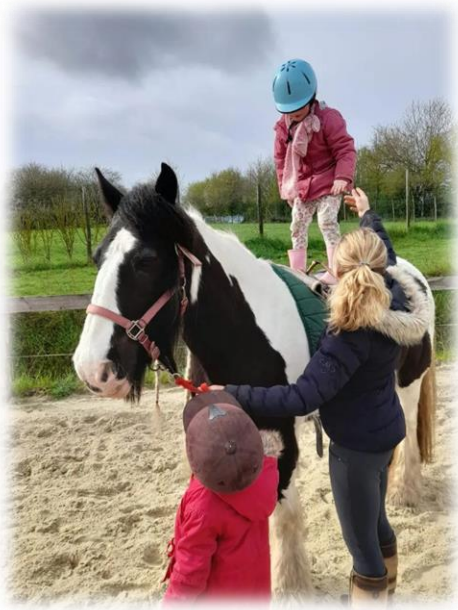
Médiation équine p.2