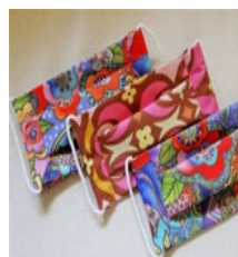
Masque en tissu