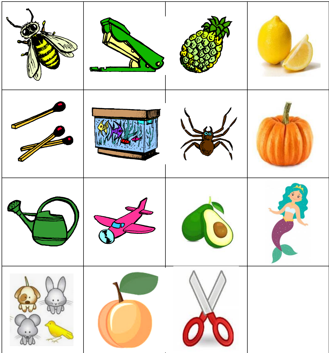
abeille agrafeuse ananas citron allumettes aquarium araignée citrouille arrosoir avion avocat sirène animaux abricot ciseaux